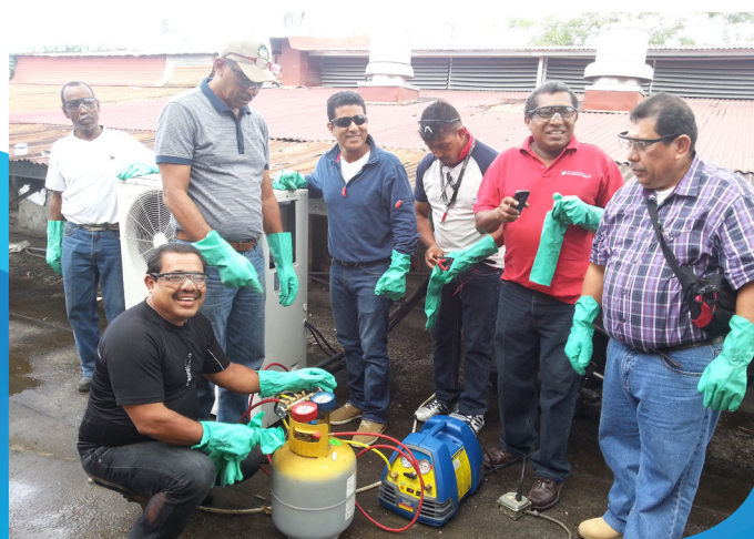
Vistas del desarrollo de las capacitaciones a los mecánicos de RAC en las instalaciones del INADEH de Tocumen