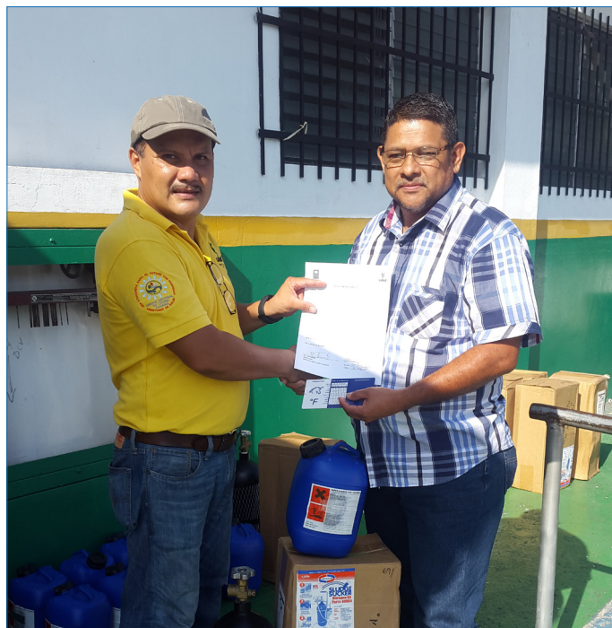
Actos de entrega de kit de herramientas a propietarios de talleres de servicio en las provincias de Panamá Oeste y Panamá

La UNO organizó reuniones con el INADEH, la Asociación Panameña de Aire Acondicionado y Refrigeración (APAYRE), la JTIA y la Sociedad Panameña de Ingenieros y Arquitectos (SPIA) para coordinar esfuerzos con el objetivo de aumentar la capacitación técnica y el establecimiento de un procedimiento de certificación bien definido y más expedito. En el año 2013 se logra, a través de un convenio de cooperación entre la SPIA y el INADEH, el apoyo técnico y la agilización de los procedimientos de certificación, dando como resultado que 106 mecánicos de refrigeración cumplieron con los requisitos y obtuvieron el certificado de idoneidad.