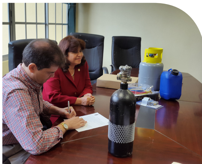
Actos de entrega de kit de herramientas a directivos del INADEH Tocumen y la Facultad de Ingeniería Mecánica de la UTP