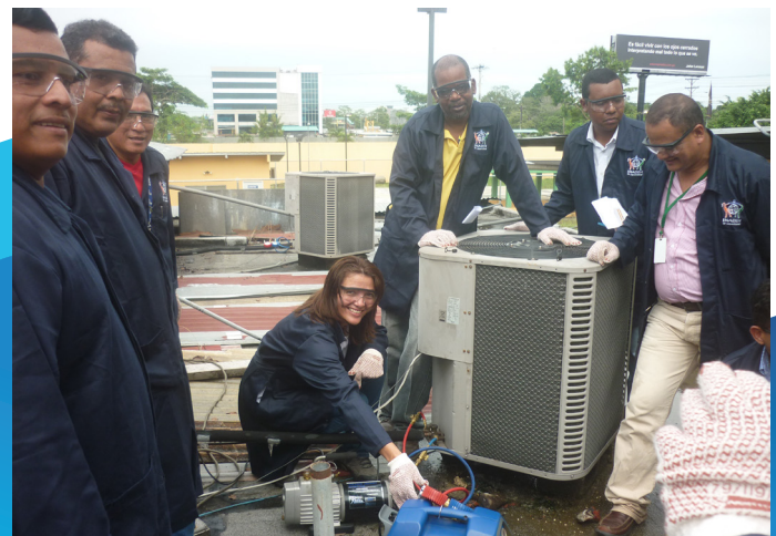
Los instructores realizan la práctica de recuperación del HCFC-22 de un equipo de aire acondicionado para reconvertirlo a HFC-422D