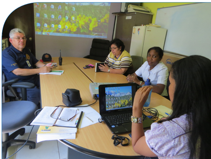
Reunión del Comité de Hidrocarburos en las oficinas de la Dirección General de Normas y Tecnología Industrial del MICI

El resultado fue la aprobación de la Resolución Ministerial N°1236, del 27 de diciembre de 2012, que establece los mecanismos de regulación y control de las importaciones de SAO, correspondientes a las sustancias del Anexo 1, Grupo C del Protocolo de Montreal. Mediante este instrumento legal, no sólo se adopta el procedimiento para la asignación de cuotas, sino que también se aprueba el cronograma de reducción de consumo de los HCFC y la eliminación total del consumo del HCFC-141b en forma pura, a partir del 1 de enero de 2014.