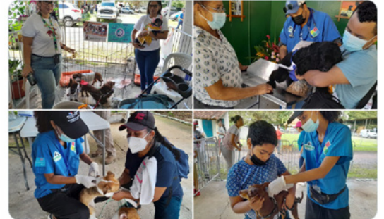
4:07 p. m. - 15 oct. 2022 - Twitter Web App

#Coclé | Realizamos por segundo año la feria Yo Amo Mi Mascota, No al Maltrato Animal, en el marco del mes de bienestar animal, en la cual se ofrecieron servicios gratuitos de vacunación antirrábica, desparasitación, vitaminas y atención veterinaria a 250 perros.