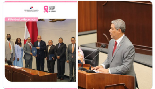
8:11 a. m. - 25 oct. 2022 - Twitter Web App

El ministro de Salud, @LPacoSucre presentó a la @assembleapa un anteproyecto de ley para la creación mediante Ley de la Dirección Nacional de Alimentos y Vigilancia Veterinaria, para garantizar la inocuidad de los alimentos en los distintos procesos hasta llegar al consumo humano.